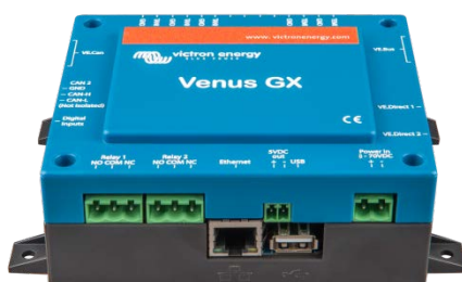
Venus GX – vue de face