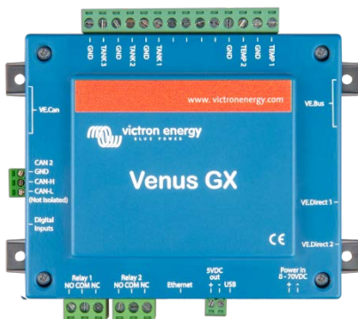
Venus GX avec connecteurs