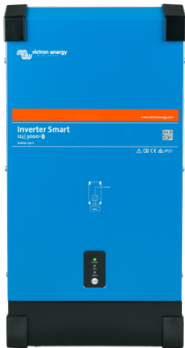
Omvormer Smart 12/3000