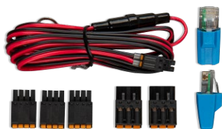
Accessoires inclus avec le Cerbo GX

Le Cerbo GX est facile à monter et peut aussi être monté sur un rail DIN à l'aide de l'adaptateur DIN35 small (non inclus). Son écran tactile séparé peut être boulonné sur un tableau de bord, éliminant ainsi la nécessité de réaliser des coupes exactes (comme avec le Color Control GX). Comme il se connecte facilement avec un seul câble, vous n'aurez pas à amener de nombreux fils jusqu'au tableau de bord. La fonction Bluetooth permet une connexion et une configuration rapides avec notre application VictronConnect.