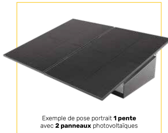
Exemple de pose portrait 1 pente avec 2 panneaux photovoltaïques

Sable, Gravier, Ciment avec tapis de protection membrane fourni