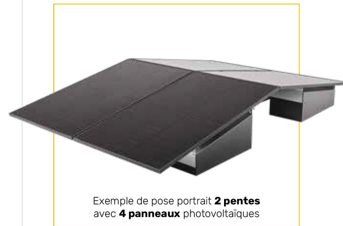
Exemple de pose portrait 2 pentes avec 4 panneaux photovoltaïques