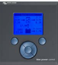
Tableau de commande Blue Power

Une solution pratique et bon marché pour une surveillance à distance, avec un bouton rotatif pour configurer les niveaux de PowerControl et PowerAssist.